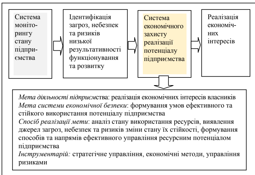
Рис. 2. Логічна послідовний дій формування системи економічної безпеки на основі підходу реагування за результатами

2) Система моніторингу результативності діяльності підприємства та управління нею шляхом управління ресурсним потенціалом підприємства та підприємницькими можливостями розвитку. При цьому стан використання потенціалу підприємства розглядається в якості індикатора системи протидії небезпекам і загрозам. Відповідно до даного підходу стан економічної безпеки визначається на основі реалізації результативного підходу до її оцінювання. Система управління економічною безпекою базується на виявленні наслідків низької ефективності використання ресурсів і можливостей розвитку та відповідних змін з метою забезпечення ефективності використання ресурсів (рис. 2).